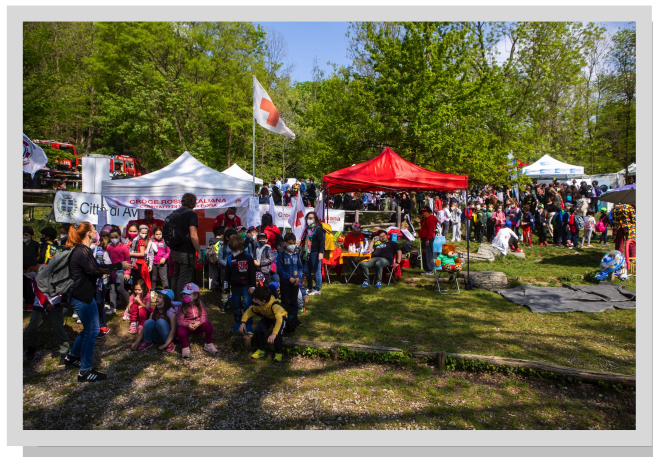
FIGURE PROFESSIONALI COINVOLTE: Medici, infermieri ed operatori tecnici sanitari dell'ASLTO3, personale di servizio degli Enti Pubblici e volontari delle Associazioni di volontariato locale partecipanti.

MATERIALE DIDATTICO FORNITO: Materiale informativo per ogni classe ed attestato di partecipazione per ogni alunno; (si precisa che trasporti e accoglienze alberghiere, sia in termini economici ed organizzativi, sono a totale carico della scuola partecipante).